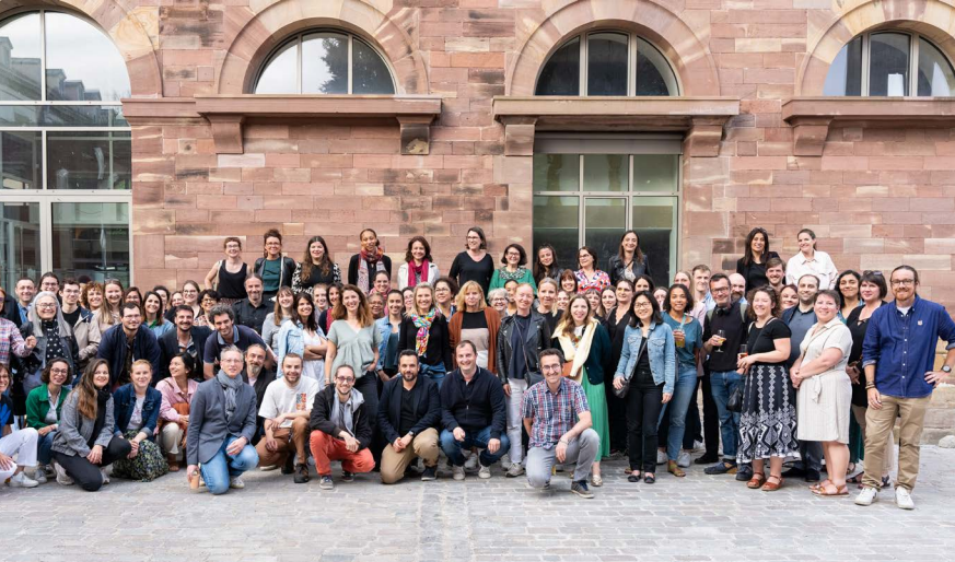
des moments de rencontres et de cohésion