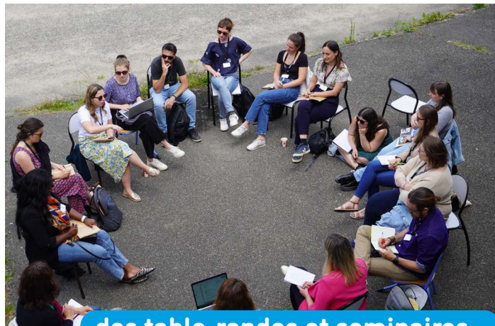
des table-rondes et séminaires