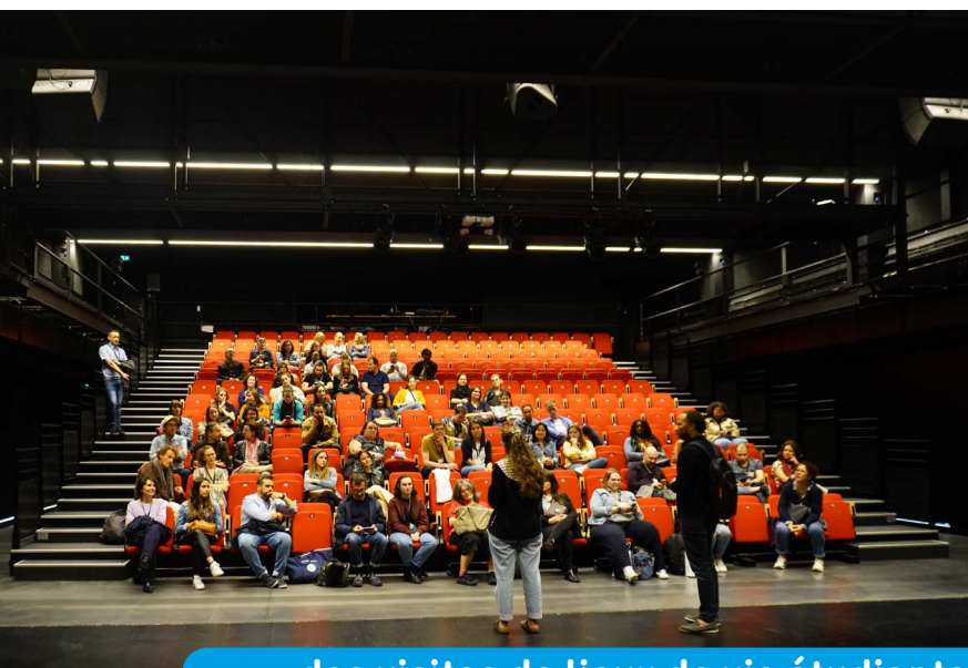
des visites de lieux de vie étudiante